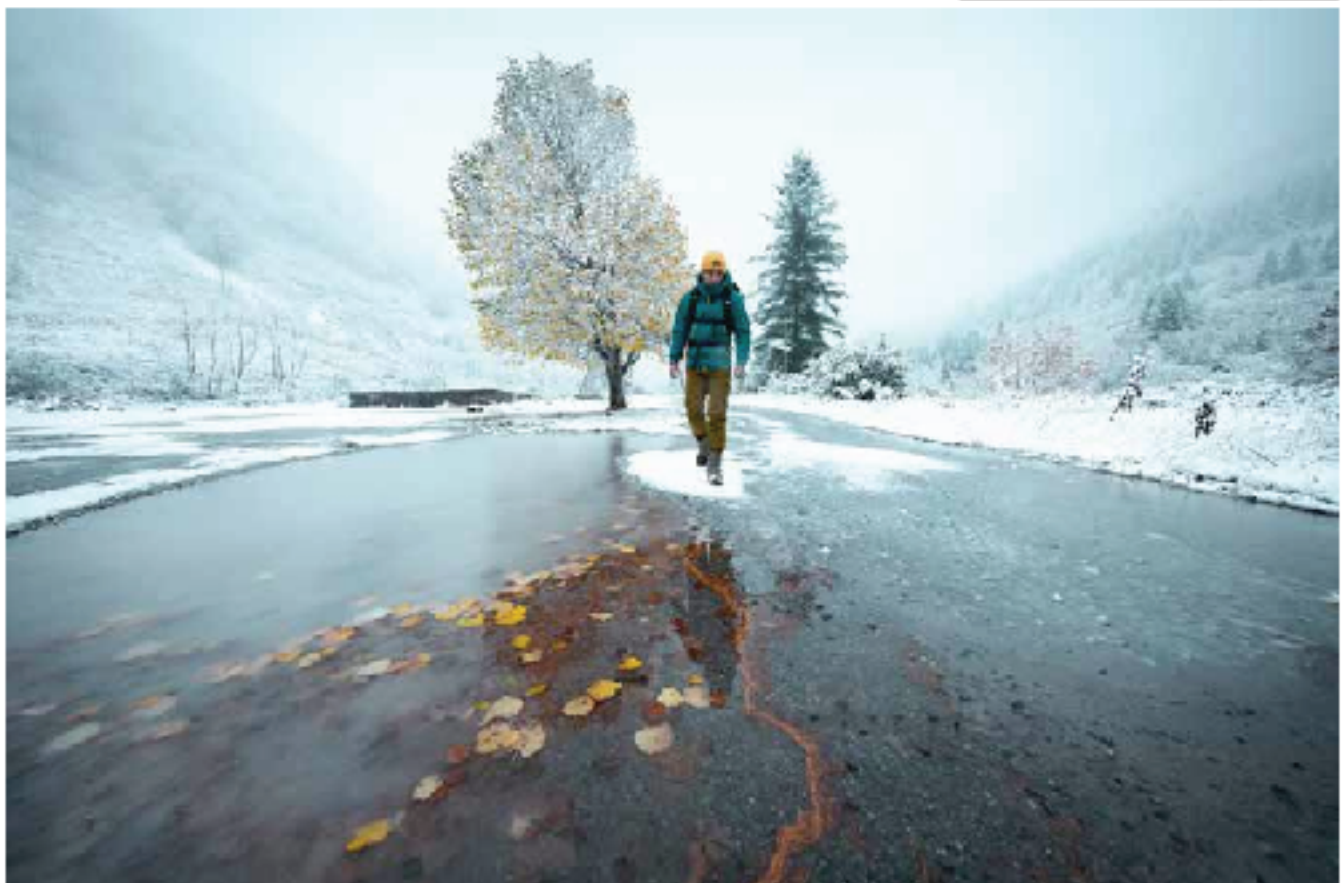
Caminando sobre hielo, paisaje invernal

Yo me considero un fotógrafo versátil y polivalente. Otra cosa es que mi trabajo haya logrado mayor repercusión en temas de outdoor , aventura, naturaleza, fauna... se me encasilla un poco ahí. Cuando empecé en esto, que no hace tanto, unos diez años, el palo que más tocaba era el surrealismo. Empecé haciendo trabajos surrealistas de edición de iPhone sin tocar Photoshop, y es una faceta mía de la que estoy muy orgulloso. Me gusta mucho el retrato, me gusta el paisaje, he hecho eventos... Yo creo que me manejo bien simplemente porque lo que me mueve es la pasión. Pero sí que es verdad que en lo que me desenvuelvo bien es en la montaña, es lo que me apasiona. Yo soy de Bilbao, y de Gorliz de adopción, un pueblo de costa y claro, la temática que más toco es la montaña. Hasta hace tres años hacía medio año en la playa y medio año en la montaña, y eso me estaba suponiendo un freno. La decisión de irme a vivir a la montaña todo el año, para vivir en Villanúa (Huesca), ha supuesto una explosión de trabajo para mí, una explosión de generar contenido, porque realmente es donde tengo que estar y en estos últimos tres años lo he notado muchísimo. Yo salgo de mi casa y en treinta segundos ya estoy pisando el sendero y eso es muy importante para el trabajo que