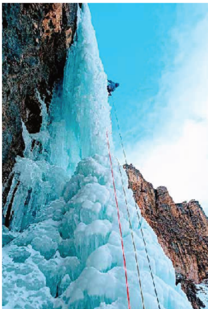
Gozi labi dako azken metroak egiten

Mondiko kiroi-taldekaria eta suhiltzale ofizial. 30 urte baino gehiago daramatza eskalatzen. Gipuzkoako mendi eskolako jardueretan mendi eta eskaladako irakasle moduan zentrat eskola eman ditu. Bere kiurikuluaren hainbat jardura esanguratsu ditu, Patagoniako Cerro Torreko Finarr bidea esaterako. Eskalatzeak leku kurbunak ditu Ordasa, Piku Urrialtu, Montañosa edo Marborera besteak beste.