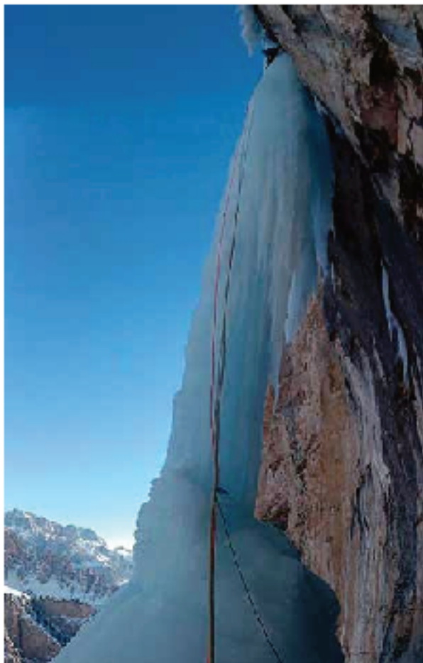
Who let the dogs out bidaren azken luzean

tere erraza. Izotz faltak zegoen apurra ahulagoa egiten zuen, eta izotz-kandela batzuk meheak zeuden. Borroka batean jardun ondoren, iritsi zen gora. Tronerrek berak kateatzea lortu zuen.