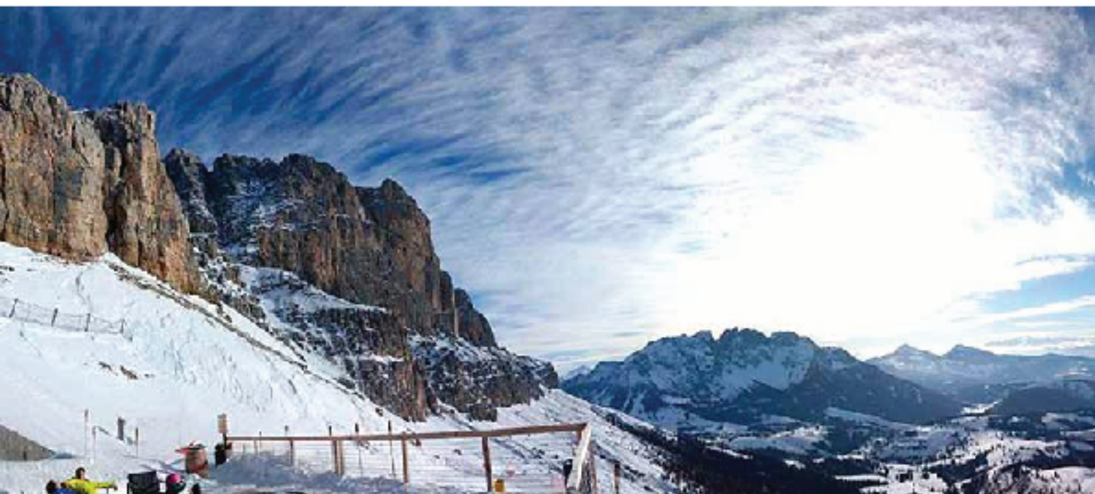
Bigarren eguneko paraie zoragarria, Who let the dogs out bidean eskalatu eta gero

haitzean gehiago eskalatu behariko genuela, eta makurgune handiagoarekin, hau da, hasiera ikidena emanda.