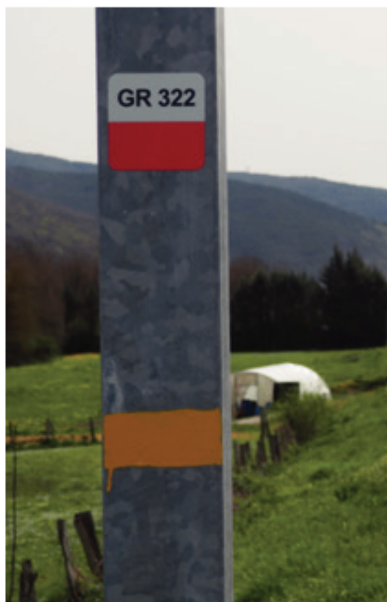
Tramo de la GR que recorre el arcón de la carretera NA-138 a la altura de Saigots

encontramos un poste indicador. Continuamos por un herboso camino por el que descendemos hasta la regata Errotalarre. La cruzamos y nos adentramos en el hayedo, comenzando un tendido y agradable ascenso, por senda, que nos lleva hasta Mixuletako bidea, por el que continuamos en cómodo descenso, alternando tramos de bosque y claros. Pasamos junto a Beltrareneko borda (717 m) y dos viejas caserones, en donde el camino se convierte en sendero y vuelve a penetrar en el frondoso bosque, transitando por un túnel de bojés tapizados de musgo.