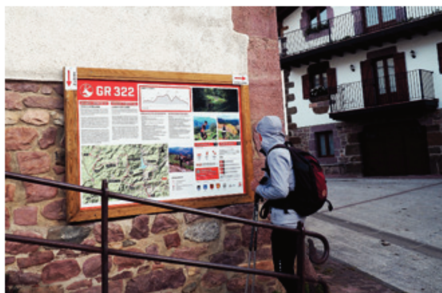
Consultando los cartales informativos de la GR 322 en el albergue de Lantz

Comenzamos la bajada caminando junto a la alambrada y un fuerte descenso