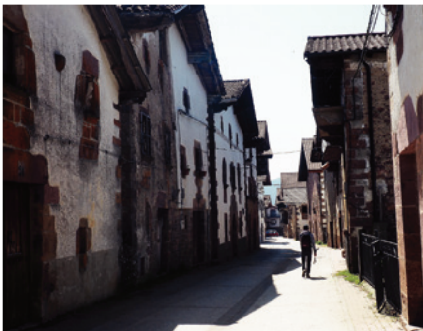
Recorriendo las calles de Lantz

Al ser una ruta lineal de tres etapas, nos obliga a contar con un vehículo de apoyo que nos recoja en el lugar de fi-