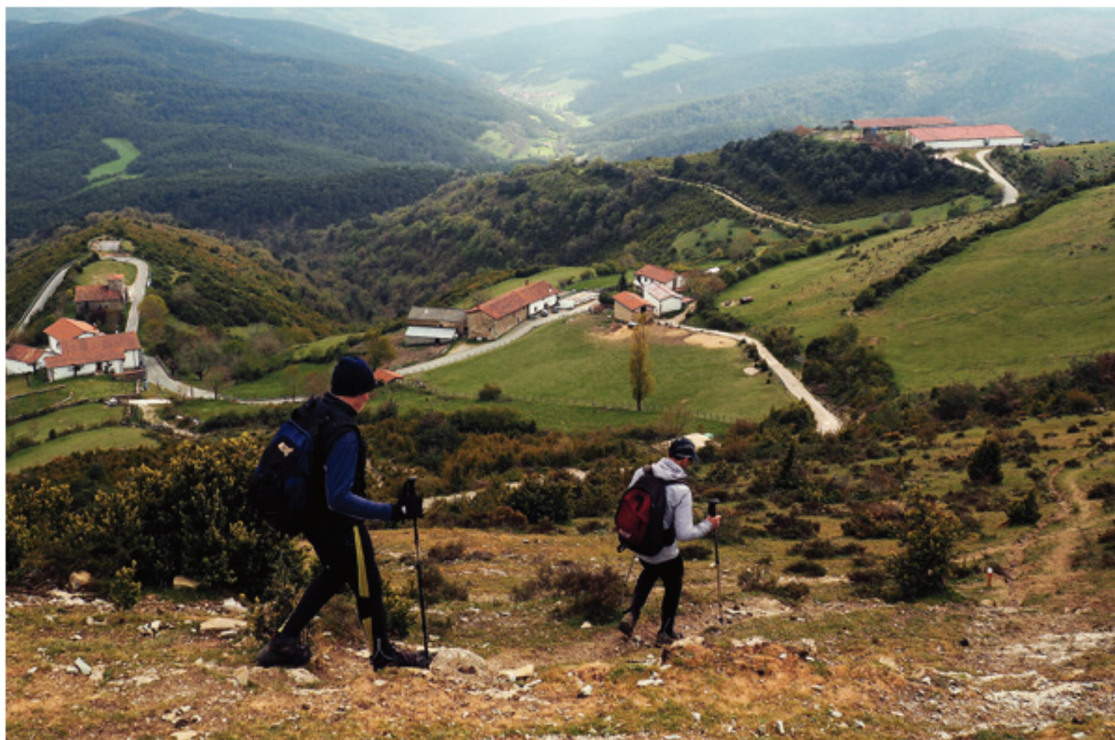
Bajando hacia el pueblo de Usatxi