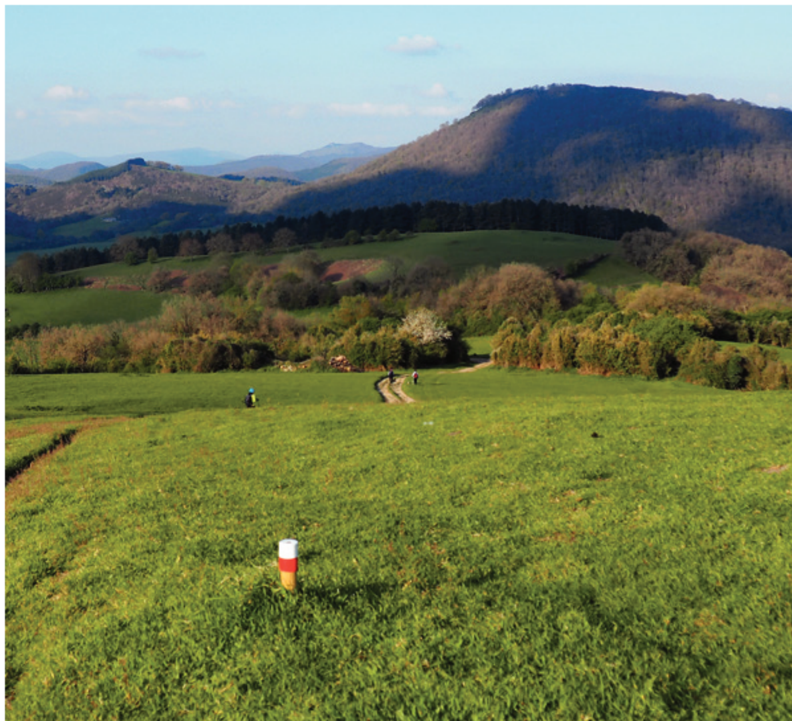
Recorriendo el camino entre prados que nos baja hasta la localidad de Aritzu

(1335 m) y, antes de llegar a las cercanías de Iturondoko bidea, nos desviamos por la izquierda, entre helechos, para tomar un camino que se adentra en el hayedo. Seguimos perdiendo altura, por pistas de saca de madera, hasta llegar a una encrucijada de pistas.