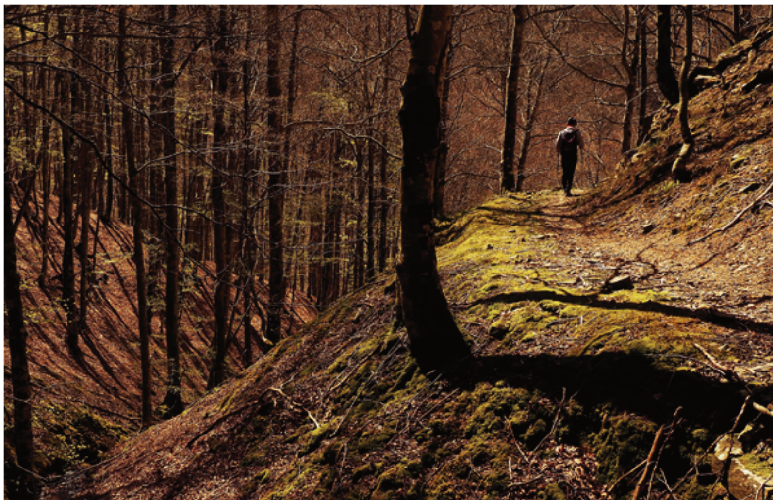
Racorriendo la fantástica senda, que cruzando varios barrancos y mekas nos lleva hasta Lantz

nalización de cada una de estas etapas. Otra alternativa es organizar las etapas contando con el apoyo de la gran oferta de servicios de alojamientos y taxis que