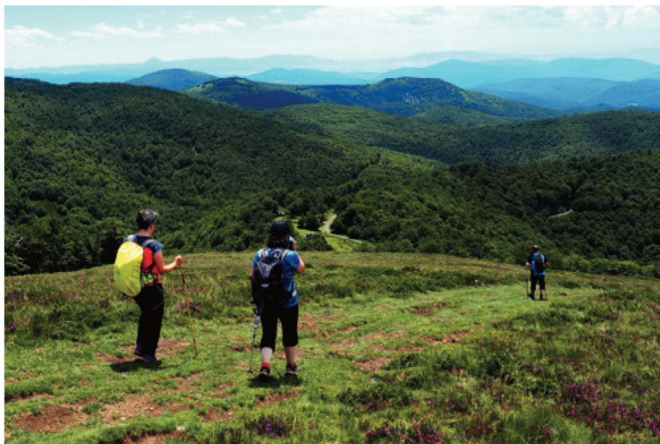
Comenzando el descenso desde la cima de Iturondo hacia el espléndido hayedo que nos bajará hasta Lantz

desde donde comenzamos el descenso hasta Larraingo lepoa (1009 m), discreto collado en medio del bosque. Después, una pista cementada nos bajará, con sus correspondientes atajos, hasta el puerto de Urkiaga (911 m), donde daremos por concluida esta 1ª etapa.