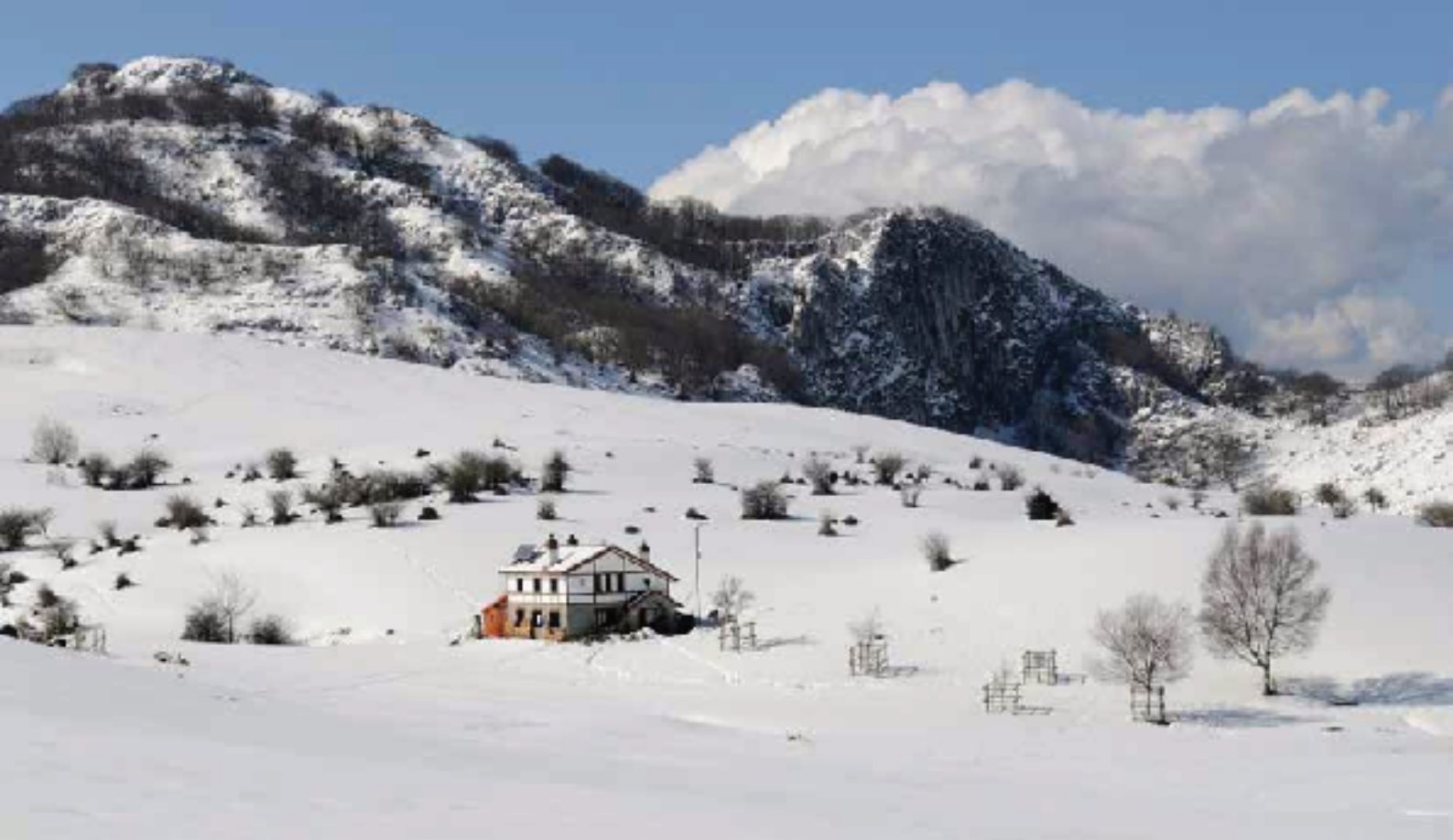
El refugio Ángel Sopaña en Arraba

tes campos nevadas de Arraba. Las pocas nubes bajas del comienzo del día han dejado paso a un cielo azul que por momentos nos deslumbraba.