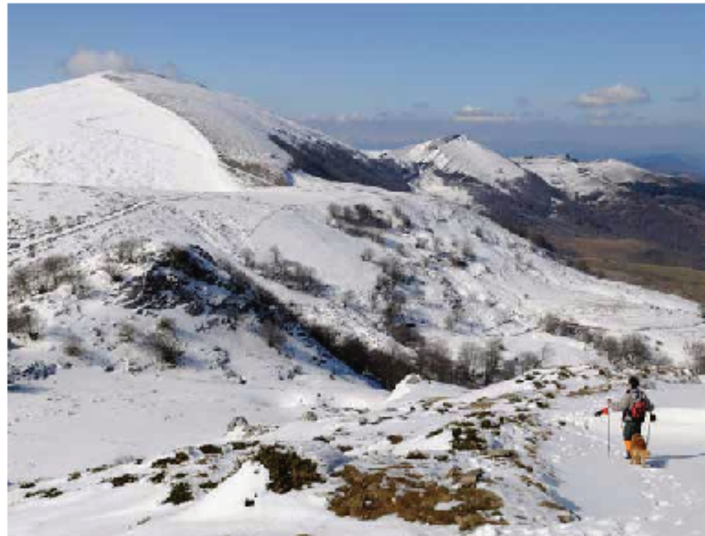
Oderiaga y otros montes de Arno

Pronto comenzamos a bajar hacia Aldamiñoste y giramos a la izquierda, hacia Egiriñao. La nieve está más dura en esta vaguada orientada al noroeste, pero no resulta necesario ponerse los pinchos. Frente a nosotros tenemos otra bella es-