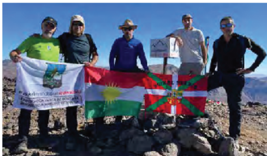
Fotografía en la cima del Halgurd

dar las mochilas y evaluar la situación (3030 m). Nos vemos ya cerca de las estratificaciones rocosas que caen del cordal del Halgurd que alcanzamos en breve. Por ellasladeamos a media altura ganando altitud de forma imperceptible al oeste por terreno inestable, muy fragmentado a nuestro paso, debido a la mala calidad de la roca y el grijo.