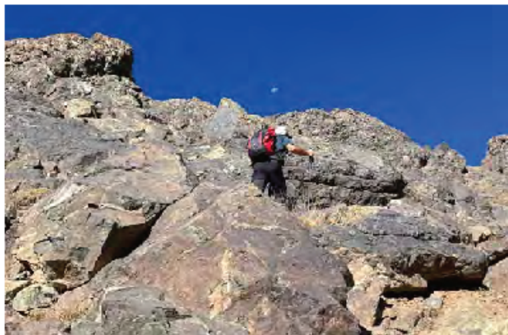
Ascendiendo al collado del Halgurd

Apenas dos semanas antes de nuestro aterrizaje en Erbil, capital desde 1991 del incipiente KRG (Kurdish Regional Government), varios drones explosivos y misiles de corto alcance surcaron con sigilo una tranquila y cerrada noche para colisionar en el aeropuerto de la ciudad. Tan solo unos días más tarde, los mismos perpetradores –desde el otro lado de la frontera iraní– lanzaron una nueva retahíla de mortíferos artefactos que aterrizaron en esta ocasión sobre varias aldeas y macizos fronterizos. Nuestros anfitriones kurdos rezumaban sorprendentemente tranquilidad; no en vano –en tiempos de Saddam Hussein– fueron miles las peque-