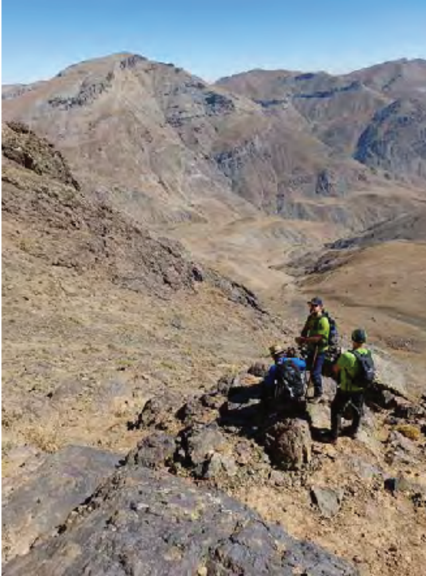
Momento de descanso observando el paisaje hacia Irán con el Cheekha Dar a la izquierda