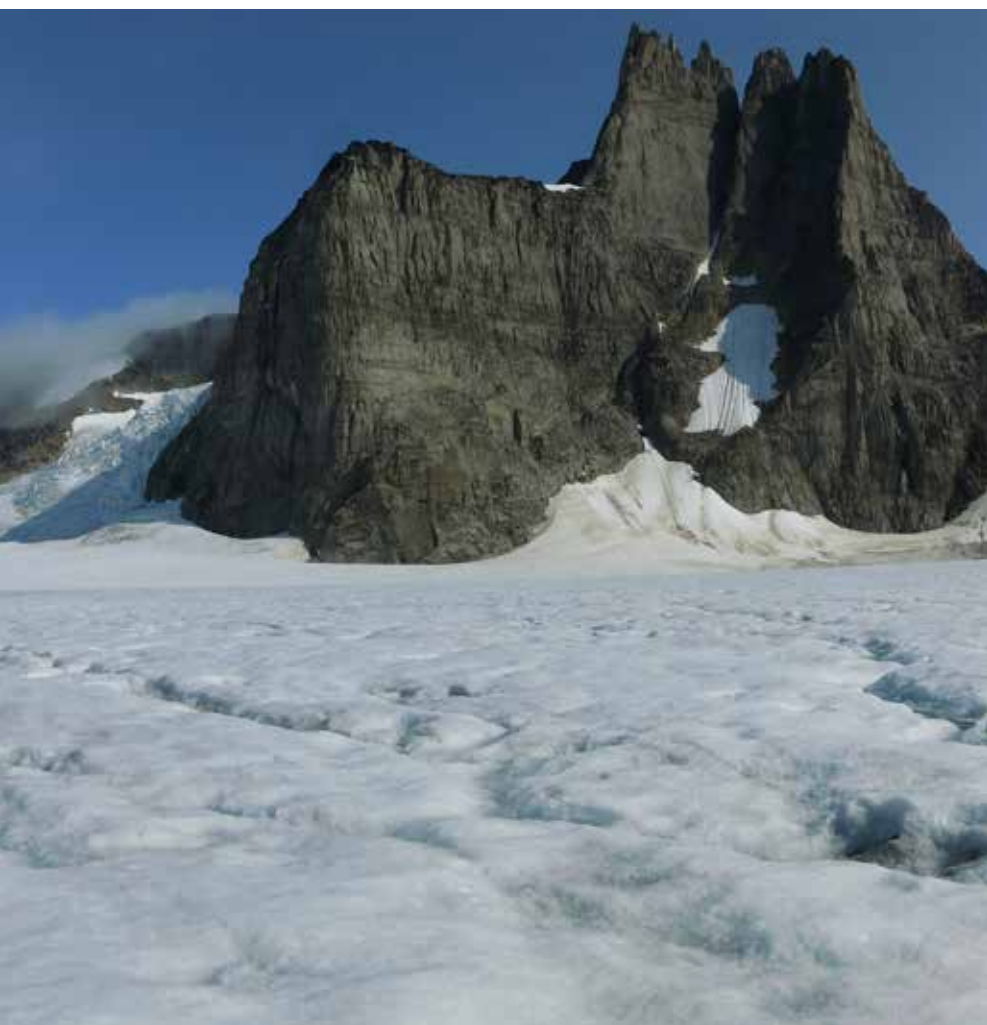
Nunataks en el extremo sur de la Capa de Hielo de Groenlandia

En Alluitsup Paa nos desviamos hacia el interior del fiordo del mismo nombre para visitar los restos de la antigua misión morava de Liut-