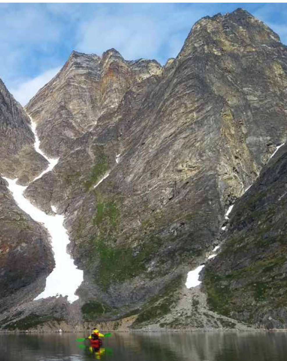
Isla de Ammalortoq

No teníamos referencias y, por lo tanto elegimos una ruta sin certezas de si encontraríamos barreras naturales importantes. Pero la elección de la ruta resultó buena (salvo la parte en la que nos perdimos en un enorme laberinto de grietas) y llegamos sin grandes dificultades a lo alto del plateau de hielo en dos jornadas. La fiesta nos la aguaron las nieblas. Tres días seguidos de niebla no nos dejaron tiempo para buscar una ruta de bajada a la costa E. Afortunadamente la niebla se disipó una tarde para dejarnos contemplar las montañas del fiordo de Lindenow, que tiene fama de ser uno de los más bellos de Groenlandia.