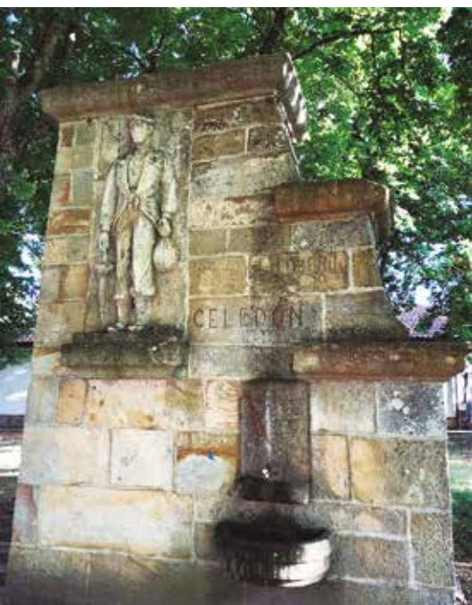
Fuente Celedón en Zalduondo

https://www.elcorreo.com/alava/araba/201407/10/derrumba-campanario-siglo-xvii-20140710114343.html