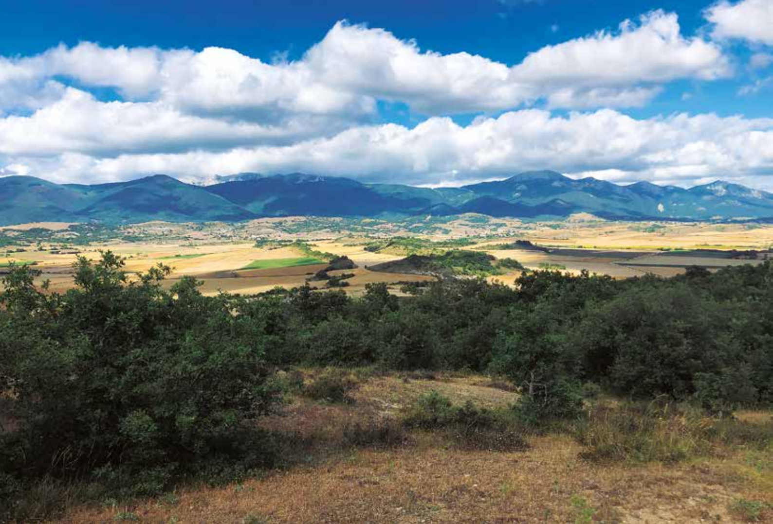
Vistas hacia Aizkorri-Aratz bajando a Luzuriaga

a lo largo de la historia. Fue concebido como monasterio, tuvo un hospital para peregrinos y viajeros del Camino de Santiago, fue ermita de gran devoción y, en sus años de decadencia, allá por el siglo XIX, se convirtió en almacén agrario y casa particular de un vecino de la zona. A pesar de los avatares del tiempo, el Santuario de Estíbaliz es una de las joyas del románico en Euskadi y lugar de referencia para todos los alaveses, que acuden en romería cada 1 de mayo (fiestas de San Prudencio y Nuestra Señora de Estíbaliz).