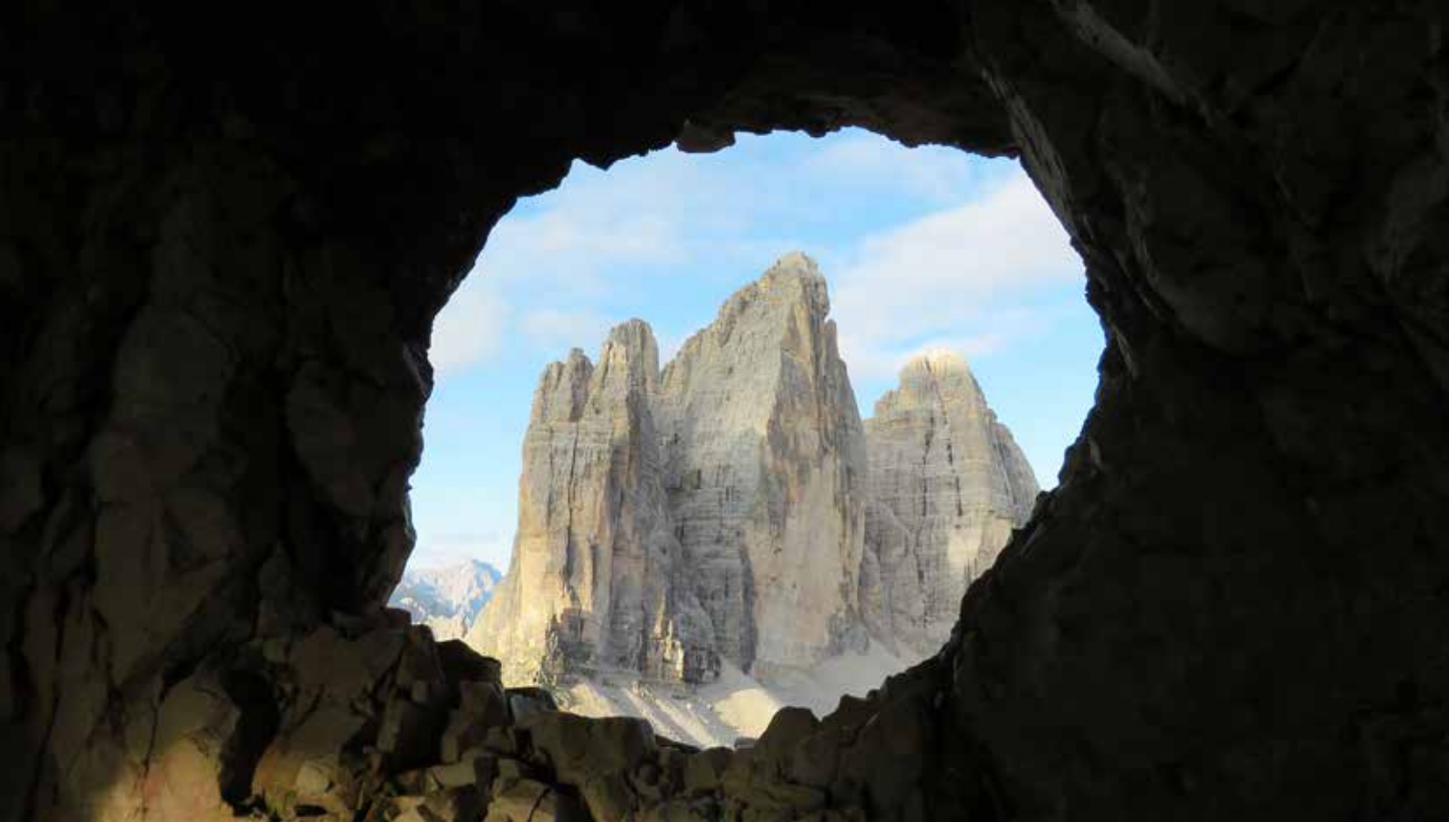
Tre Cime di Lavaredoko hiru tontorrak

bidesaria utziz, guk ordea ez dugu horren beharrik izan, goiz ibiltzearen onuretako bat ordainlekua irekita edukitzea baitzen gure harridurarako. Ferrata luze bat egiteko asmatan gindoazenez, gure erritmoan aritzeko gogoz, goizeko seiak eta laurdenetan ekin diogu ibilbideari eguzkia irtetearekin batera.