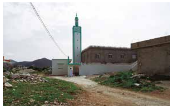
Minarete de Oued el Marsa

Negociamos a la salida del puerto un taxi, que designan entre todos los taxistas que están esperando, y que nos acercará hasta la