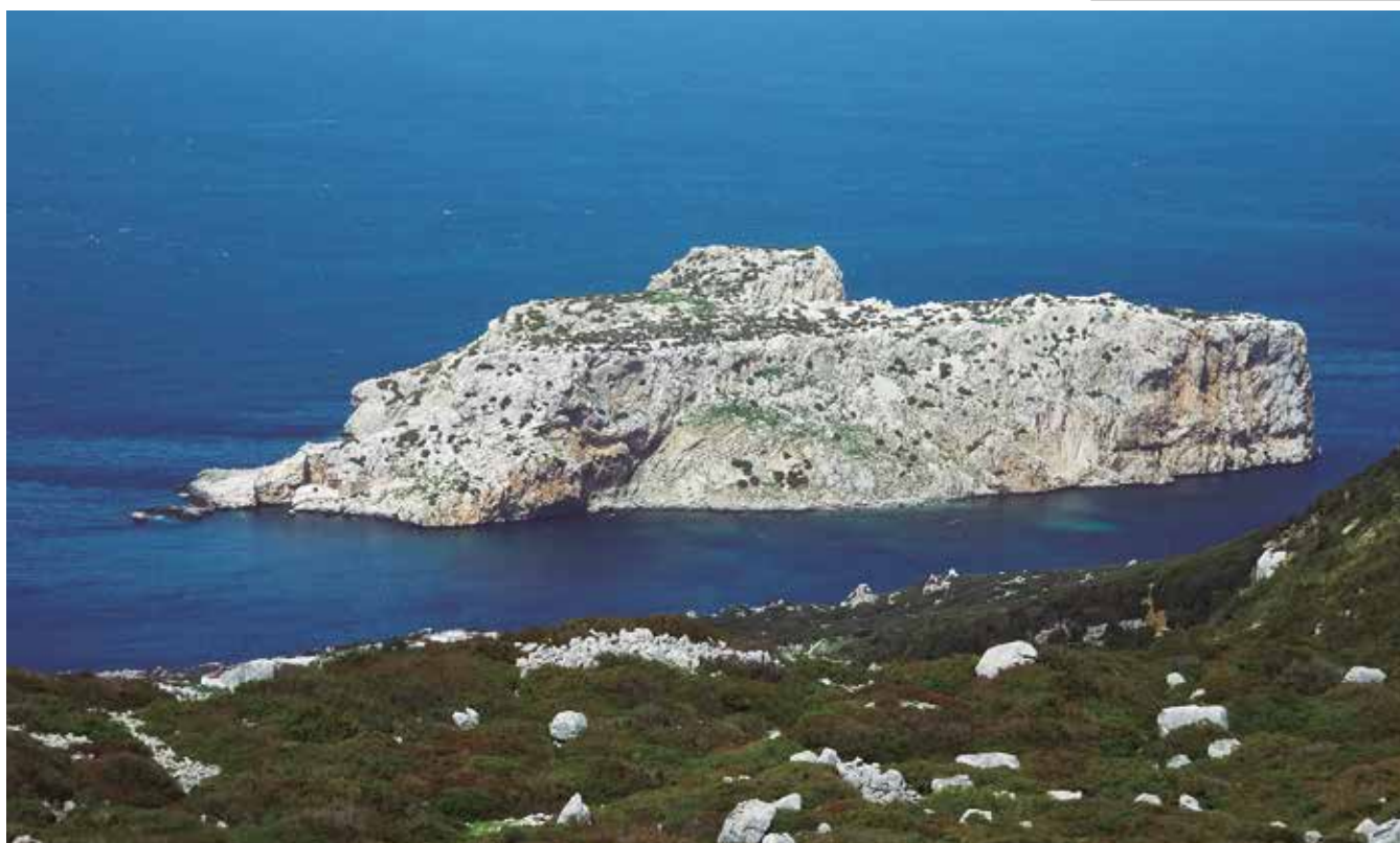
Islote Perejil o Leila