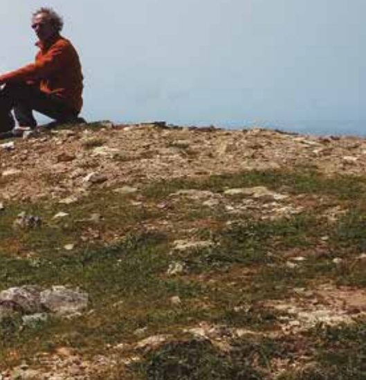
Morabito de la cima

Una hora después estamos al pie de la pared (496 m), resguardándonos del viento. Empezamos a subir por una incómoda pedrera, que