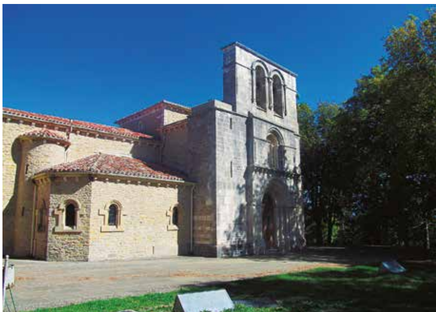
Estibalizko eliza albo batetik