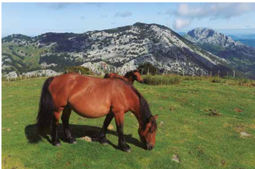
Unos habituales de la cima de Saibi

Un trago de agua en la fuente que ya conocemos (travesía Otxandio-Atxondo) y subimos por carretera hasta el caserío Atxekoa,