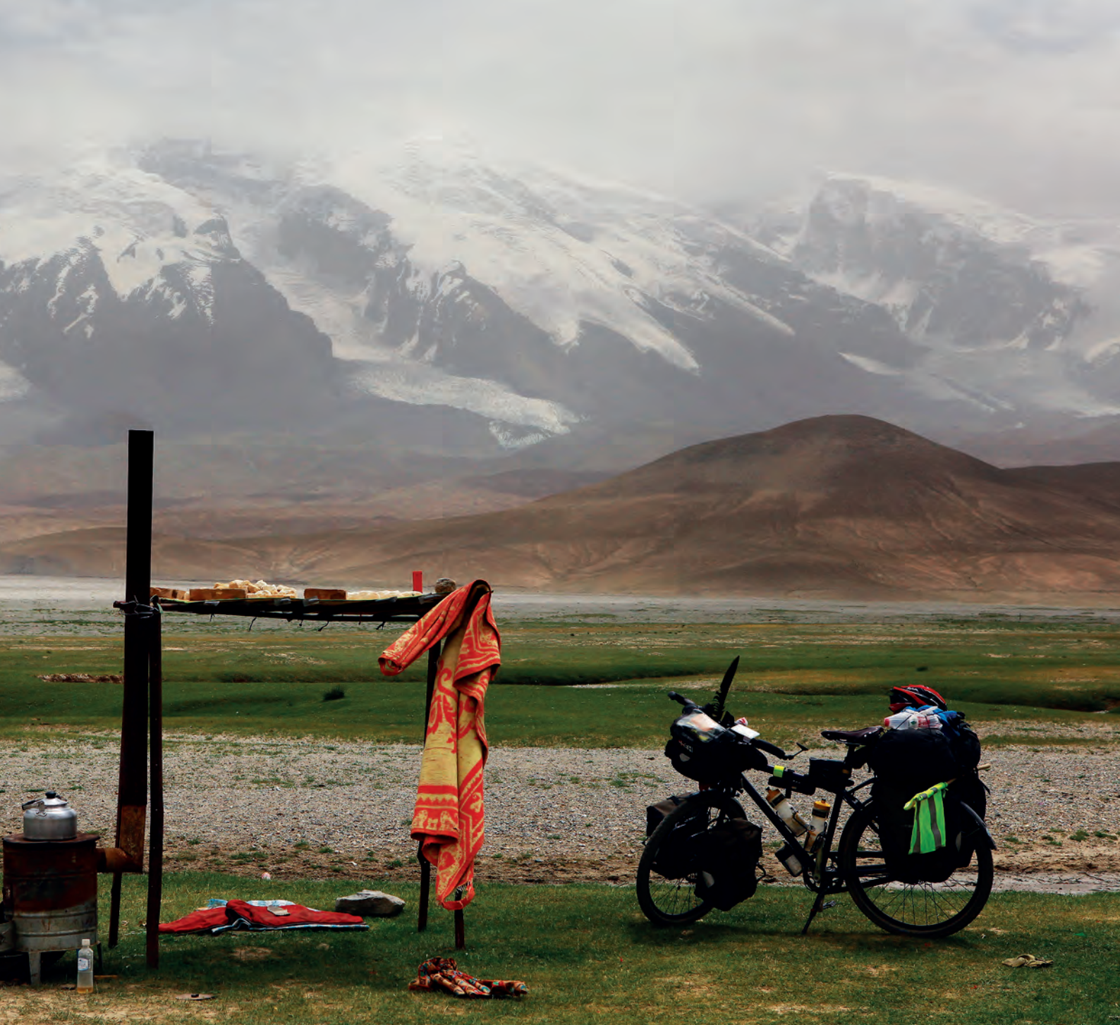
Kongur shan mendiaren ondoan

dut hirukotea. Bide horretan, bi 4x4 darabiltzate Shimsaletik Passura joan-etorriak eginez egu-nero, taxi modura. Beraien ustez, bizikleta auto gainean jarri eta, Shimsalera heltzea posible dela jakin ondoren, nire burua ibilgailuaren barruan ikusi dut beste behin Simshalera bidean.