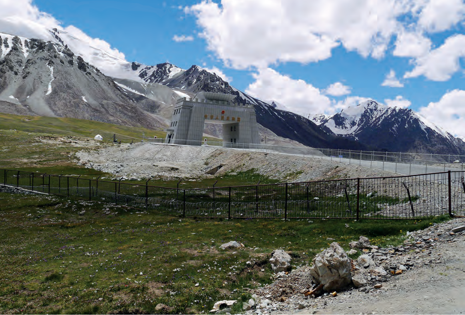
Kunjerab pass, 4880 m

zako printzeriaren zentroa izan zen 1974 urteraino. Karimabad aldapatsuaren kaleetan zehar egiten dut gora eta behera jakiak erosi eta kafetxo batekin gorputzari atsedendaldia emateko. Minapin herria daukat hurrengo helmuga. Bertan, bizikleta utzi eta Rakaposhi mendiaren oinarrizko kanpamendura oinez igotzeko irrikaz nago. Rakaposhi hitzaren esanahia "horma distiratsua" da bertakoen hizkuntzan, baina Dumani (hodeien ama) izenez ere ezagutzen