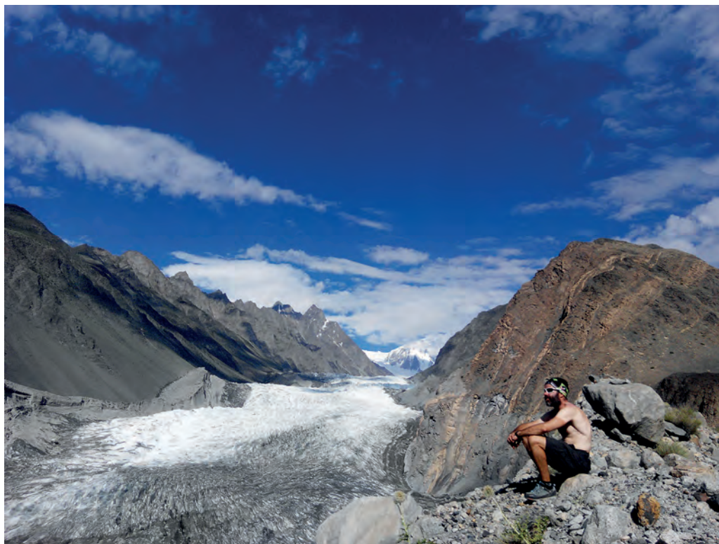
Batura glaziarrera ibilbidea

famatuak dira txinatar funtzionario tematiak. Muga askotan bezala, eskanerra egiteko gailua dute hemen ere. Daramadan guztia atera arazi didate eta makina horretara doan zintan utzi dut dena. Bakarrik nagoenez funtzionario guztiak ditut inguruan, dena ikusten eta ukitzen, baina imajina ezazue nire aurpegia zinta horren gainean bizikleta jartzea eskatzen didatenean. Nola azaldu lagunak; txoropito hauek nire bizikleta tunel txiki horretatik pasatzeko asmoa dute! Tolestu, makurtu, gorantz, beherantz..., hamaikaxo posizio probatu eta gero, ez dira ohartzen ezinezkoa dela. Alajaina!