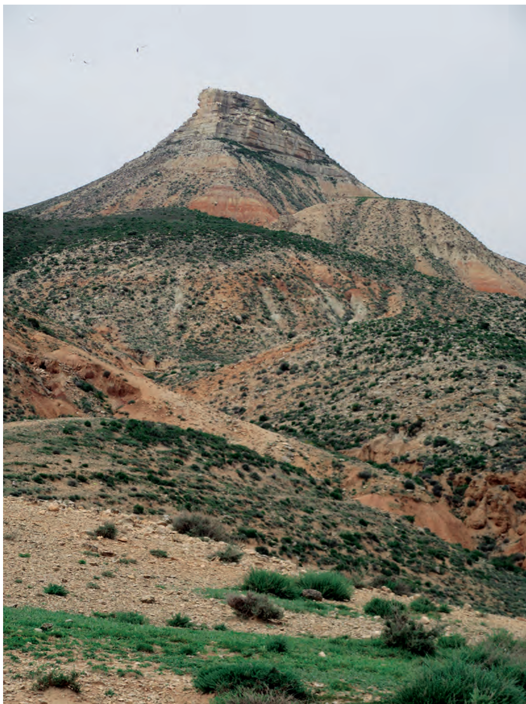
Cabezo del Fraile

Tras pasar junto una pequeña borda, se- guiremos por una senda jalonada de moje- nes hasta salir del hayedo, en el collado de Soate, presidido por un dolmen y un memo- rial (755 m; 1h 10 min). Avanzamos por una senda que gana altura por las laderas del Aizkoa y pasaremos junto al especta- cular menhir de Urdintz hasta salir al collado de Elorregi (901 m; 1h 25 min), con un po- ste direccional que indica la senda de Saioa. Crómlech. Una vez en el crestón cimero, es- taremos en 15 min en el vértice geodésico de Abartan (1095 m). Amplia vista sobre el pintoresco valle de Baztan, con numerosos