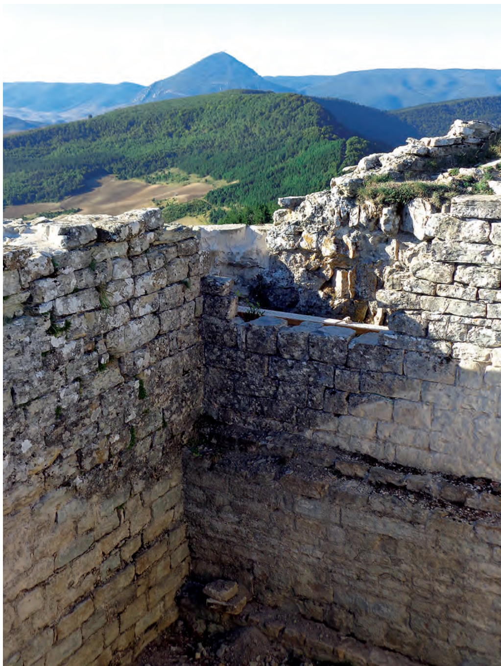
Aljibe del castillo de Irulegi

A la rocosa cumbre de Kukula de Pintano, que tuvo un castillo del Reino de Navarra conocida por los ansotanos como Castilpintano, se llegaba por una tediosa pista que, desde Burgi, llega a