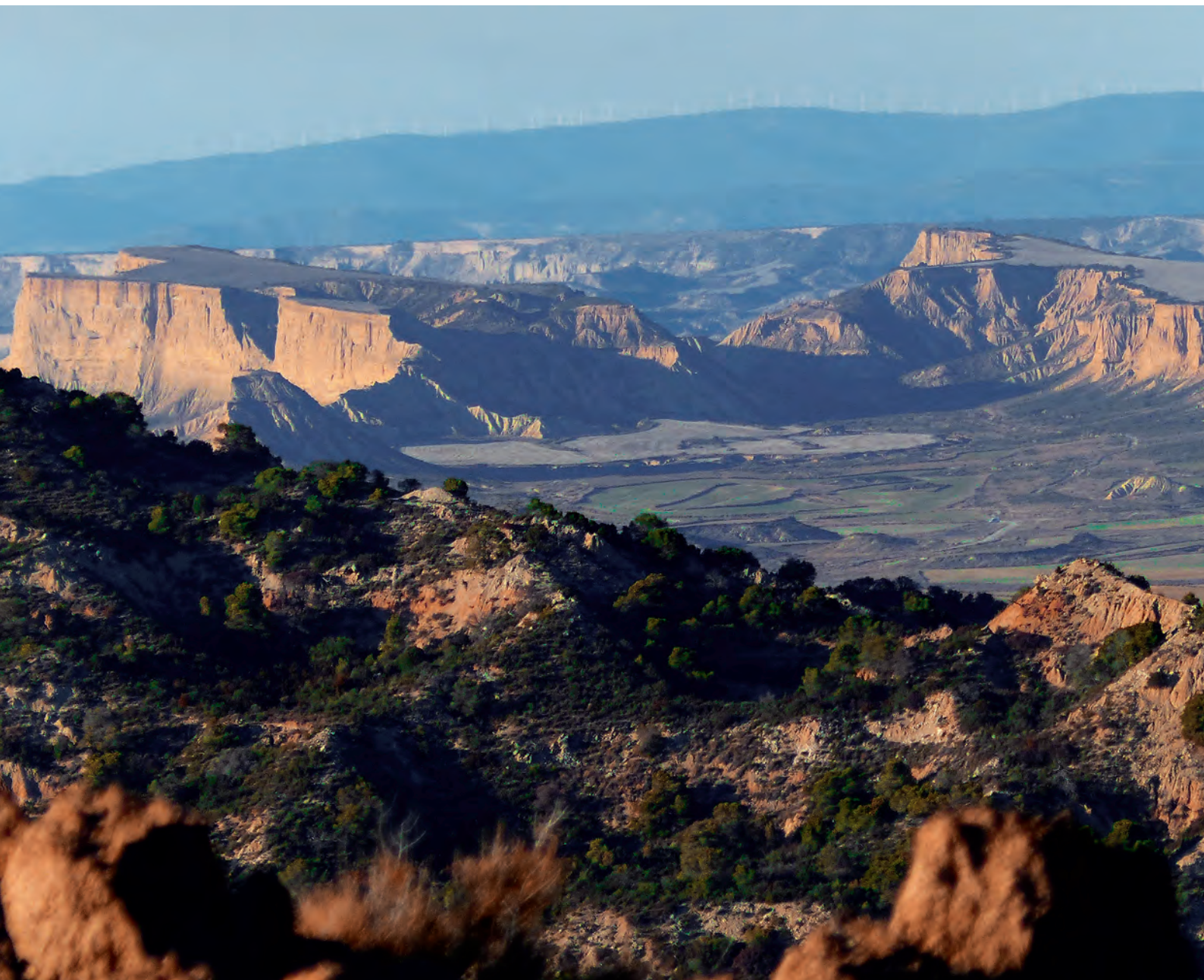
La Bardena Negra

Situados en el pueblo de Ziga (350 m), escalonado en una colina, el itinerario arranca en la parte baja del pueblo. Guiados por el citado