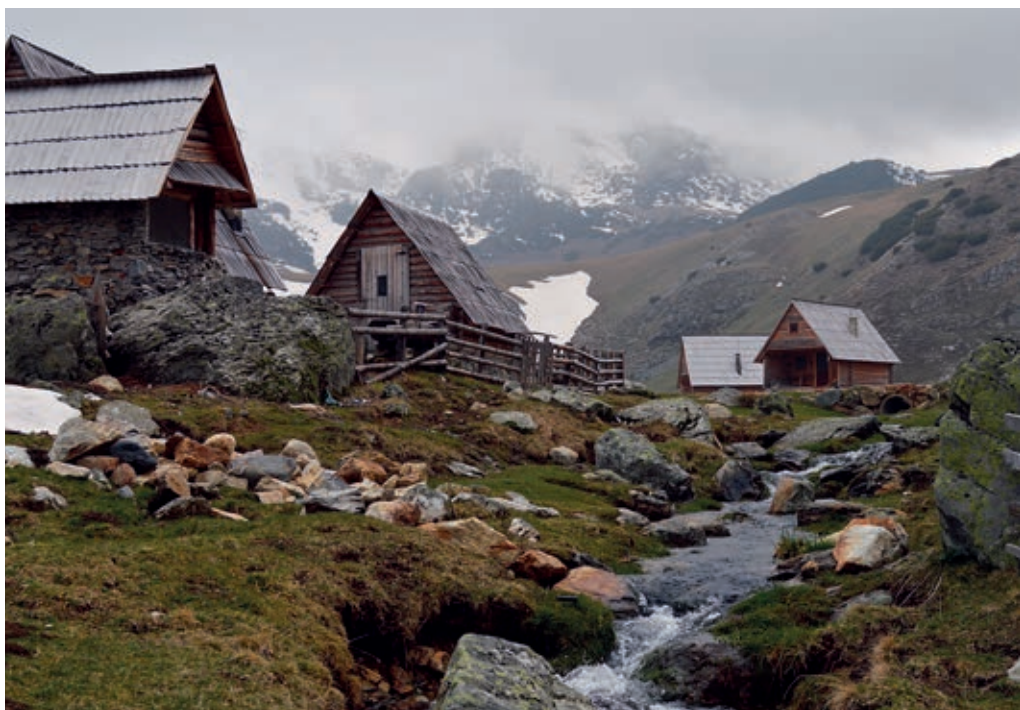
Poblado de cabañas en la falda meridional de la montaña Vranica. Atrás el pico Nadkrstac (2110 m)

El sendero marcado sube a través del valle lateral hasta la cabaña (2 h, 900 m). La ascensión continúa a través de un bosque magnífico hasta que se sale por encima de la línea de árboles. Se alcanza la fotográfica Ventana