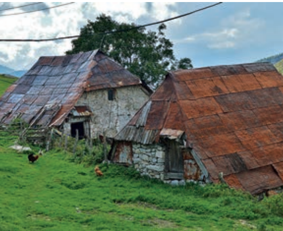
Tradicionales viviendas de piedra rehabilitadas como bordas de verano

forman crestas alineadas en torno a depresiones de origen glaciario. Al cordal más alto, una cresta por encima de los 2000 m (Zuljsko brdo) se accede fácilmente desde Umoljani. Al valle alto de Dugo Polje se puede subir por una pista desde la misma estación de esquí. Esta pista cruza la montaña hasta el pinto-