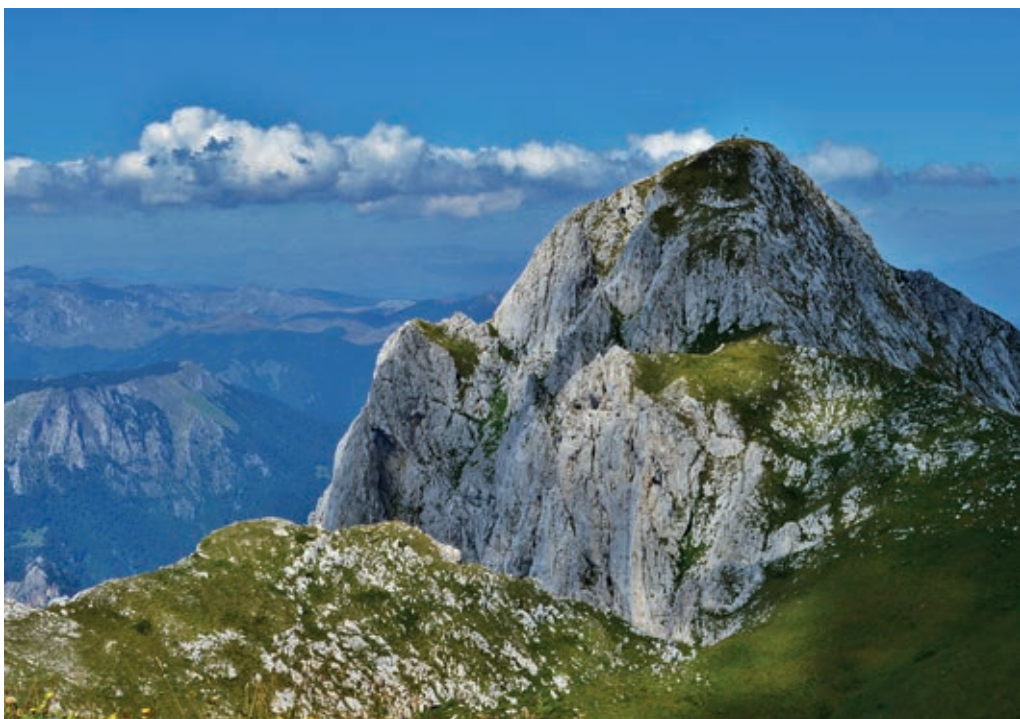
La cima de la montaña Maglič (2386 m) es el techo de Bosnia y Herzegovina

(Vrata), un espectacular aro de roca caliza, y desde allí la cima Veliki Vilinak (4-5h, 1600 m). Ruta fácil pero con buen desnivel.