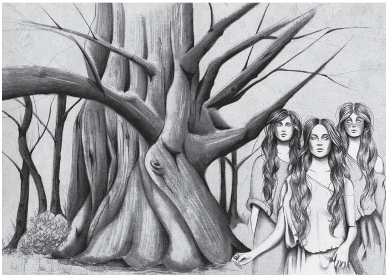
El tejo milenario de Anguiano y las Tres Marías · ILUSTRACIÓN: Melania Badosa

Los cántabros y los íberos, antiguos pobladores de la península, al parecer dieron origen al topónimo de los Cameros. El pastoreo y la trashumancia han definido históricamente a sus pueblos: los más de 3 millones de ovejas que llegaron a pastar en sus campos propiciaron que la comarca tuviera la mayor renta per cápita de Europa de la época.