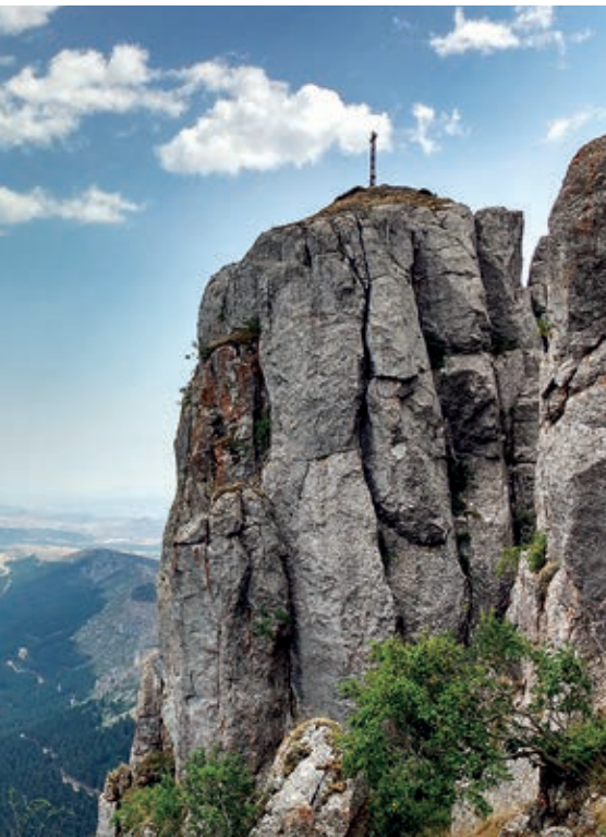
La Cruz de Peña Isasa

De forma análoga al Camero Nuevo, formado por las poblaciones del valle del río Iregua, el Camero Viejo está constituido por las establecidas en el valle del río Leza. El atractivo Cañón del río Leza es el protagonista en la parte baja del valle. Allí la sierra entra en contacto con la depresión del Ebro, formando las Peñas de Leza (1151 m) y estrangulando al río en la localidad de Soto en Cameros.