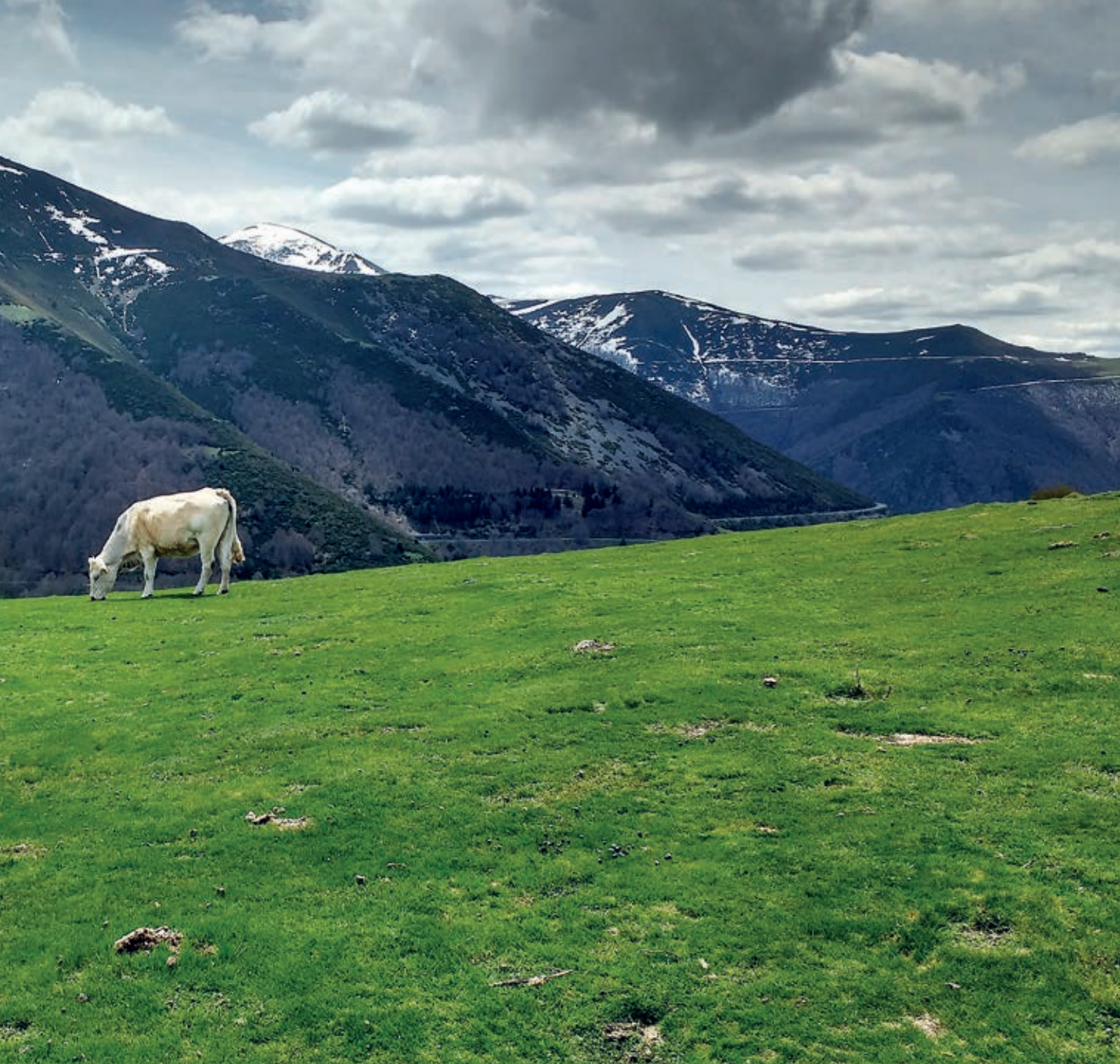
Pastos de la sierra de La Demanda

la pasan". Quizás debido a su prominencia o a sus característicos monolitos cimeros, se cuenta que fue Sansón quien, tratando de escapar de los filisteos, acorralado en lo alto de una montaña en Autol, arrancó un trozo de esta y lo lanzó con tal fuerza que fue a parar a Peña Isasa; logrando con tal proeza la huida de sus enemigos.